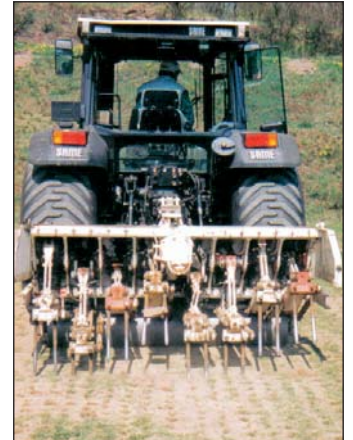
Tiefenlockerung mit Intergreen Verti Drain