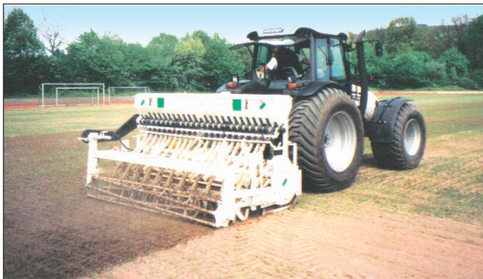
Wurzellangzeitdünger für optimale Rasenflächen

Mancher Platzwart entscheidet sich – ohne fachmännische Beratung – für das Aerifizieren. Der Platz wird dabei bis in eine Tiefe von sechs bis acht Zentimetern gelockert. Dazu kommt eine Besandung und schon sind die Schadbilder gemildert. Nicht schlecht, trotzdem bleibt das Grundproblem bestehen: Die Verdichtung ist nicht bis in ihre tatsächliche Tiefe beseitigt.