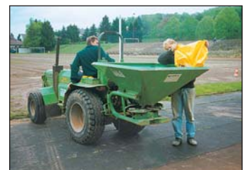
Befüllen des Düngerstreuers außerhalb des Rasens

Wenn trotz ordnungsgemäßer Düngung Störungen im Rasenwuchs auftreten, sollte sofort der Fachberater informiert und nach Möglichkeit auch hinzugezogen werden.