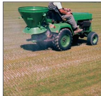
Düngen mit einem Kreiselstreuer

Die richtige Nährstoffversorgung trägt letztendlich dazu bei, dass ein Rasensportplatz von vielen Sportlern über eine längere Zeit hinweg gut genutzt werden kann. Also lautet eine wichtige Frage für alle Platzbetreuer: Wie dünge ich richtig?