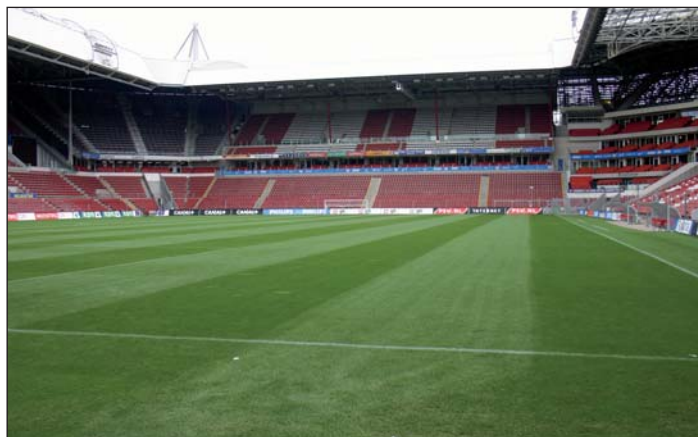
Optimale Sportrasenverhältnisse für die WM

1998/99 erbaute Intergreen-Partner Rundel aus Frankfurt/M. dort eine Sportlandschaft mit 8000 Quadratmetern Fläche. Die Rasenfläche macht seither von sich reden. Und so nimmt es nicht Wunder, dass sich die Brasilianer als Rekord-Weltmeister im Fußball bereits im September 2004 mit einer Delegation sowohl Hotel als auch Platz genau anschauen. „Tudo bem“ lautete schließlich das Urteil von Trainer Carlos Alberto Parreira, „alles klar.“ Auch ihn überzeugten die Klasse des Top-Hotels und die Intergreen-Qualität auf dem Platz.