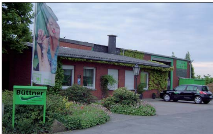
Betriebshof der Firma Büttner

Die Zukunft liegt sicherlich nicht in einer Fülle von Neubauten. Wir gehen davon aus, dass der Umbau von Sportflächen und insbesondere die hoch qualifizierte Pflege und Unterhaltung unser Auftragspektrum der nächsten Jahre sein wird.