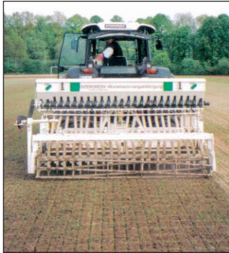
Terraforce/Aeriforce im Einsatz

Das Problem ist auf vielen Rasenplätzen das gleiche: Die Rasentragschicht ist verdichtet, regelmäßige und häufige Nutzung, Rasenschnitt und Düngung mit Maschinen sowie die Kehrgutabfuhr sorgen für Verhärtungen in der obersten Schicht bis in eine Tiefe von 15 bis 20 Zentimetern. Ist dieser Fall eingetreten, hat der Platzverantwortliche nicht nur ein einziges Problem. Nein! Einerseits liegt da der fehler- und problembehaftete Platz. Zum anderen muss er auch die richtige Maßnahme zur Beseitigung dieses Missstandes wählen. Am besten setzt er sich dafür mit dem Fachmann in Verbindung.